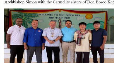
Cambodia SDB with Archbishop Simon in Don Bosco Kep.