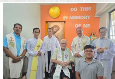
Archbishop Simon with SDB at Don Bosco Phnom Penh.