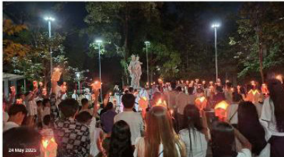
Don Bosco Sihanoukville